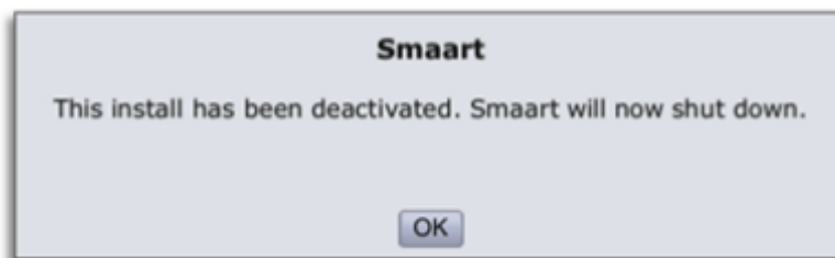
Figure 2 : Fenêtre confirmant la désactivation

Après avoir effectué un clic sur " Deactivate This Installation Now ", Smaart va tenter de se connecter à notre serveur et d'effectuer cette désactivation. Si Smaart réussit à transmettre les données de désactivation à notre serveur web, une fenêtre apparaîtra confirmant la désactivation (Figure 2).