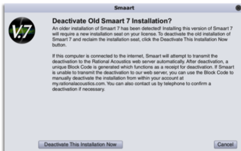
Figure 1 : Fenêtre de désactivation

Après avoir exécuté l'installation de la version 7.4 et le lancement du programme Smart , celui-ci va rechercher toute précédente installation du logiciel. Si Smart détecte une précédente activation vous verrez apparaître la fenêtre suivante (Figure 1) vous demandant de désactiver la précédente installation de Smart ce qui vous permettra d'utiliser cette activation pour la 7.4 .