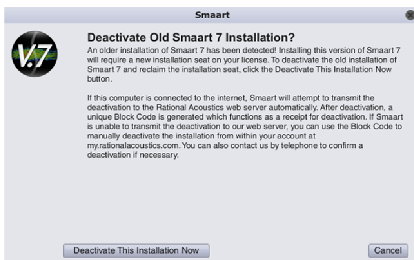
Figura 1: Cuadro de dialogo de desactivación

Después de instalar y arrancar Smaart 7.4, el programa buscará instalaciones previas de Smaart 7. Si detecta una instalación antigua activada, se presentará un cuadro de dialogo (Figura 1) que le pedirá desactivar la instalación antigua para poder usar ese asiento para la nueva instalación de 7.4.